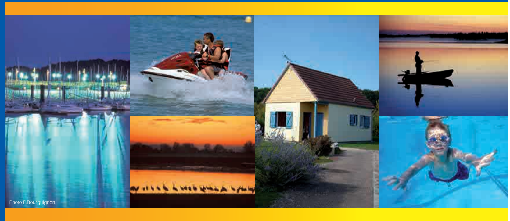
photos non contractuelles

Marina Holyder Résidence de Tourisme** - Tourism residence**